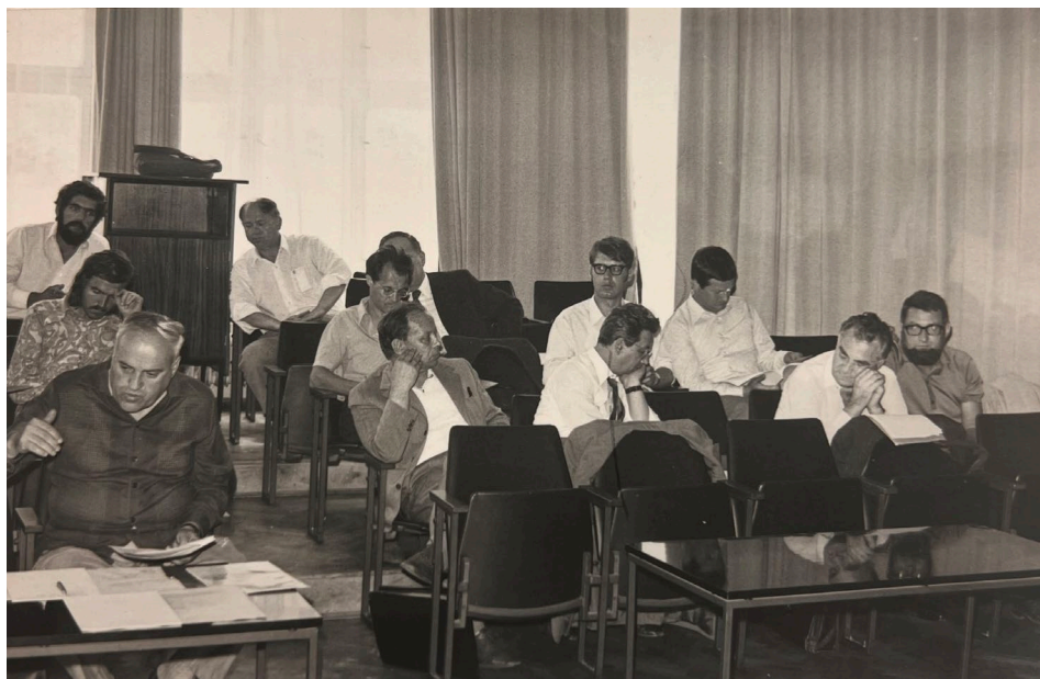
Slika 4: Prvo posvetovanje Projekta Univerze v Mariboru 28. 6. 1972