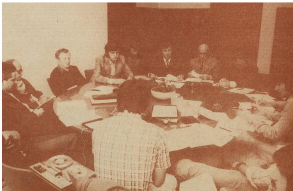
Slika 6: Razprava na okrogli mizi o osnutku Zakona o visokošolski dejavnosti

Ob prizadevanjih za ustanovitev univerze v Mariboru so potekale intenzivne priprave za gradnjo nove zgradbe visokošolske in študijske knjižnice, kar je dokumentiral Bruno Hartman v obsežnem delu Izhodišča za idejni projekt nove knjižnične zgradbe Visokošolske in študijske knjižnice Maribor (Izhodišča za idejni projekt nove knjižnične zgradbe visokošolske in študijske knjižnice Maribor, 1974).