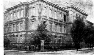
Poslojste Višje komercialne šole