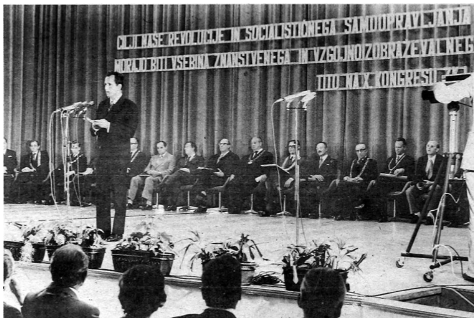
Slika 9: Govor predsednika Izvršnega sveta SR Slovenije Andreja Marınca