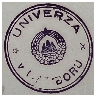
Slika 7: Eden zgodnejših dokumentov z novim pečatom mariborske univerze 11