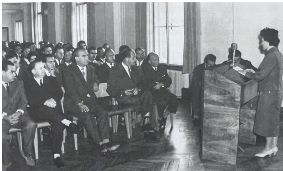
Slika 3: Otvoritvena slovesnost treh novih mariborskih višjih šol

»Z ustanovitvijo novih višjih šol izvajamo nadaljnjo dekoncentracijo višjega, visokega in univerzitetnega študija, ki je bil doslej osredotočen v Ljubljani. Višje šole organiziramo v krajih, katerih razvitost in zadostno število sposobnih strokovnih kadrov zagotavlja dostojno strokovno raven in neposredno povezanost z družbeno prakso. Dekoncentracija tega študija v razne predele naše republike pa hkrati tudi omogoča močnejše vključevanje mladine v višje šole« (Tri nove višje šole v Mariboru, 1960, str. 1–2).