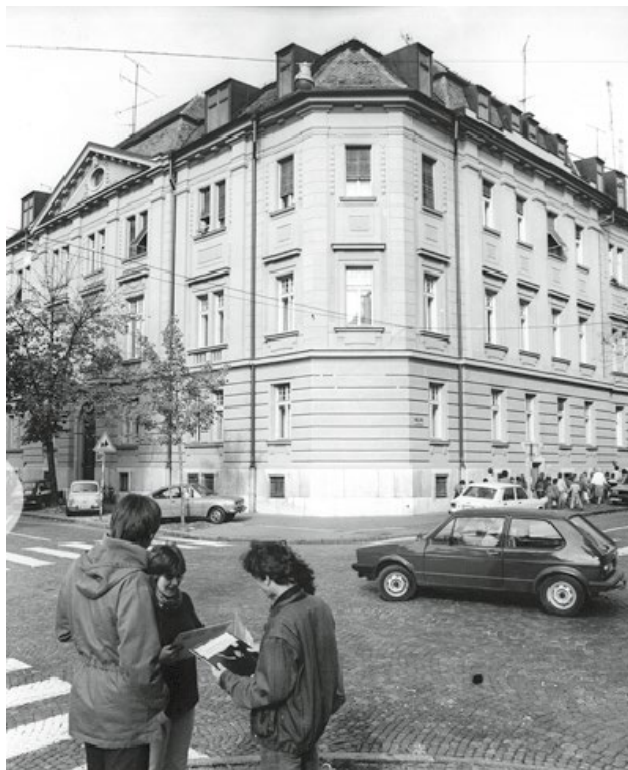
Slika 5: Rektorat mariborske univerze na Krekovi ulici 2 10

podlaga za enakopravno menjavo raznih zvrsti dela, ob tem pa naj bi se ustvarjali tudi novi samoupravni socialistični družbeno-ekonomski odnosi; tak samoupravni koncept nove univerze se je popolnoma skladal tudi z načeli kasneje sprejete ustave SR Slovenije in zakona o visokem šolstvu (Bračič, 1974; Utemeljitev samoupravnega sporazuma o združitvi v univerzo Maribor, 1975).