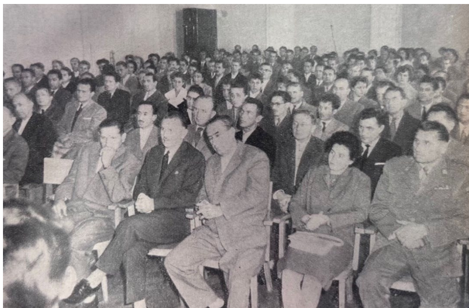
Slika 1: Svečana otvoritev Višje komercialne šole v Mariboru

dejansko potrjen šele z Uredbo o višji komercialni šoli, ki je bila objavljena 17. septembra 1959 (»Uredba o višji komercialni šoli«, 1959).