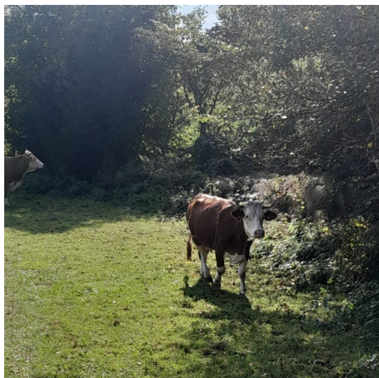
Slika 4: Krava na OPG-u Pešta