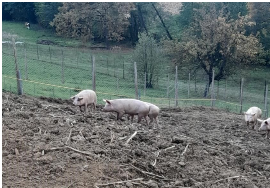
Slika 2: Svinje na OPG-u Pešta