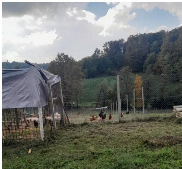
Slika 3: Kokošinjac na OPG-u Pešta