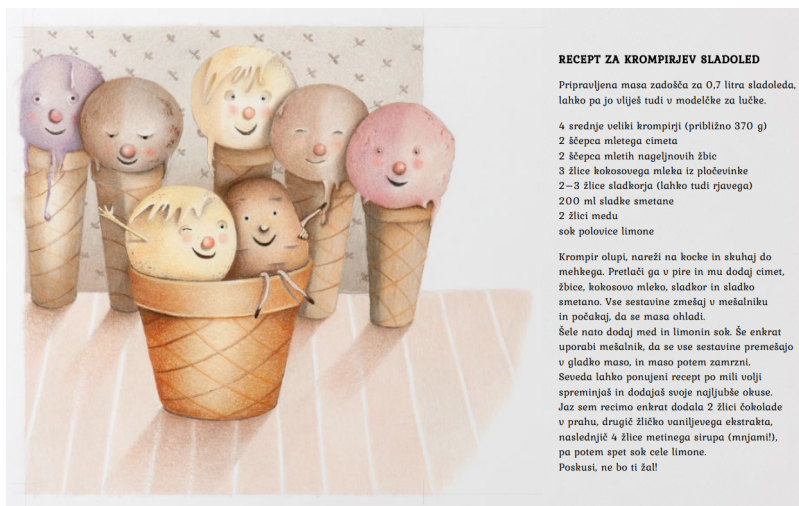
Slika 3: Recept za krompirjev sladoled

Vir: Radovanovič in Vertelj (2022: 20–21) (objavljeno z dovoljenjem založbe)