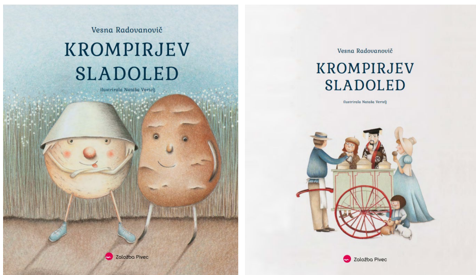
Slika 1: Naslovnica in notranja naslovnica

Vir: Radovanovič in Vertelj (2022) (objavljeno z dovoljenjem založbe)