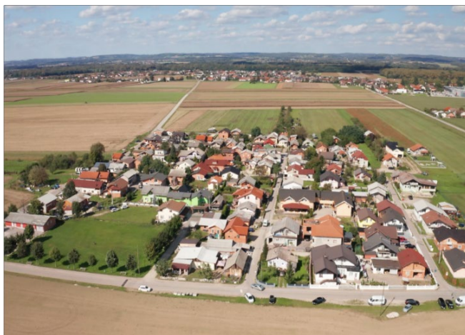
Slika 2: Romsko naselje Pušča v Mestni občini Murska Sobota (MOMSa, 2024)

Mestna občina Murska Sobota je prostor bivanja za več kot 1.100 Romov, ki živijo v naseljih Pušča, Černelavci, Nemčavci in v mestu Murska Sobota. Romsko prebivalstvo v občini je raznoliko in vključeno v številne društvene dejavnosti.