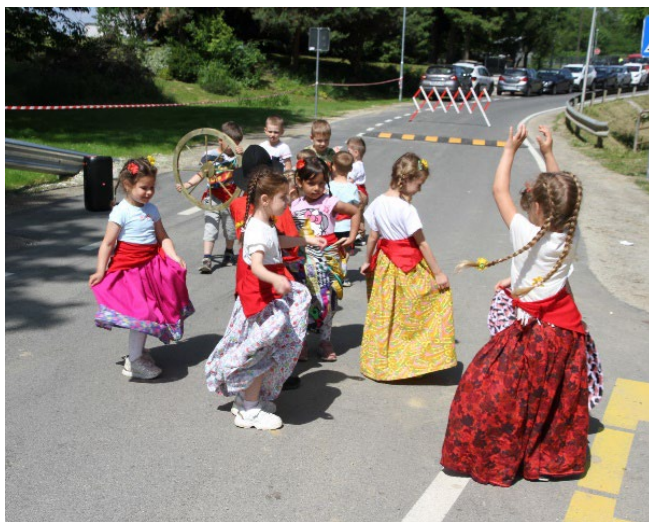
Slika 3: Otvoritev prenovljene ceste v romskem naselju v Dolgi vasi