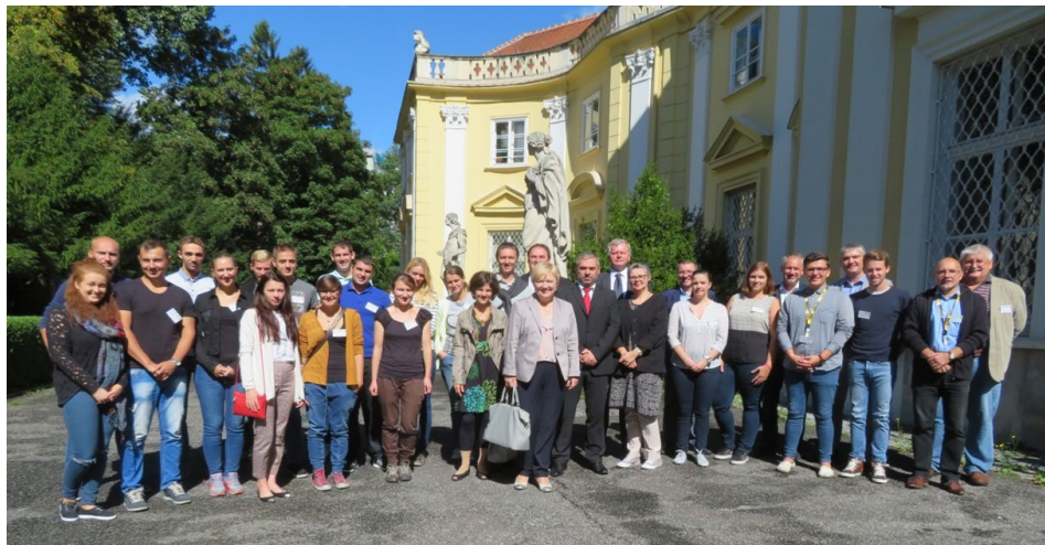
Slika 2: Udeleženci sedme poletne šole GEOREGNET v Gradcu leta 2016