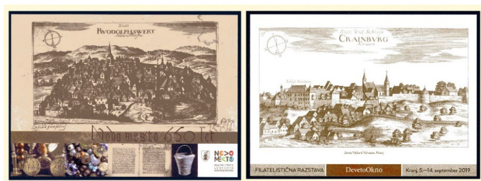
Slika 2: Razglednični dopisnici Novega mesta in Kranja, ki imata za predlogo ilustraciji iz Slave vojvodine kranjske.