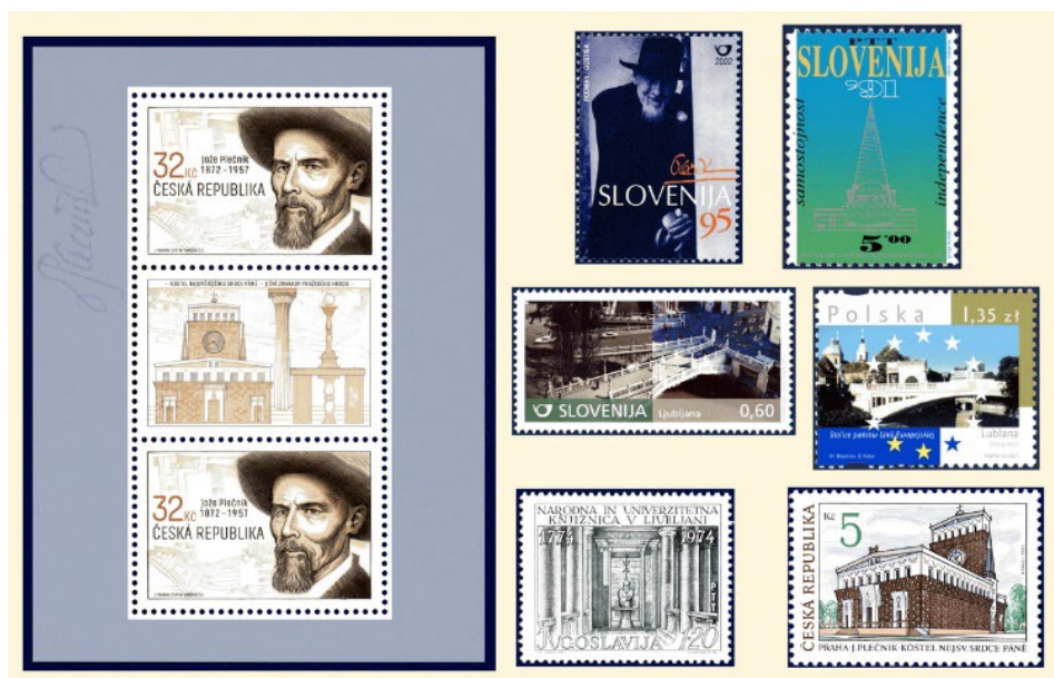
Slika 7: Češki blok in znamke, ki so posvečene Jožetu Plečniku in njegovemu delu.

Zdravnik in kemik dr. Friderik Pregl (1869–1930) je edini slovenski Nobelov nagrajenec. Dobil jo je za kemijo leta 1923. V sodelovanju s podjetjem Kuhlman je razvil na milijoninko grama natančno tehtnico. Avstrijska pošta je ob petdesetletnici podelitve Nobelove nagrade izdala znamko z njegovim portretom, ob stoletnici podelitve pa je izdala znamko tudi Pošta Slovenije. Znamki z njegovim portretom sta izdali tudi pošti Svetega Vinceta in Grenadina ter Demokratične republike Kongo. Kitajska pošta je izdala razglednično dopisnico z njegovim portretom.