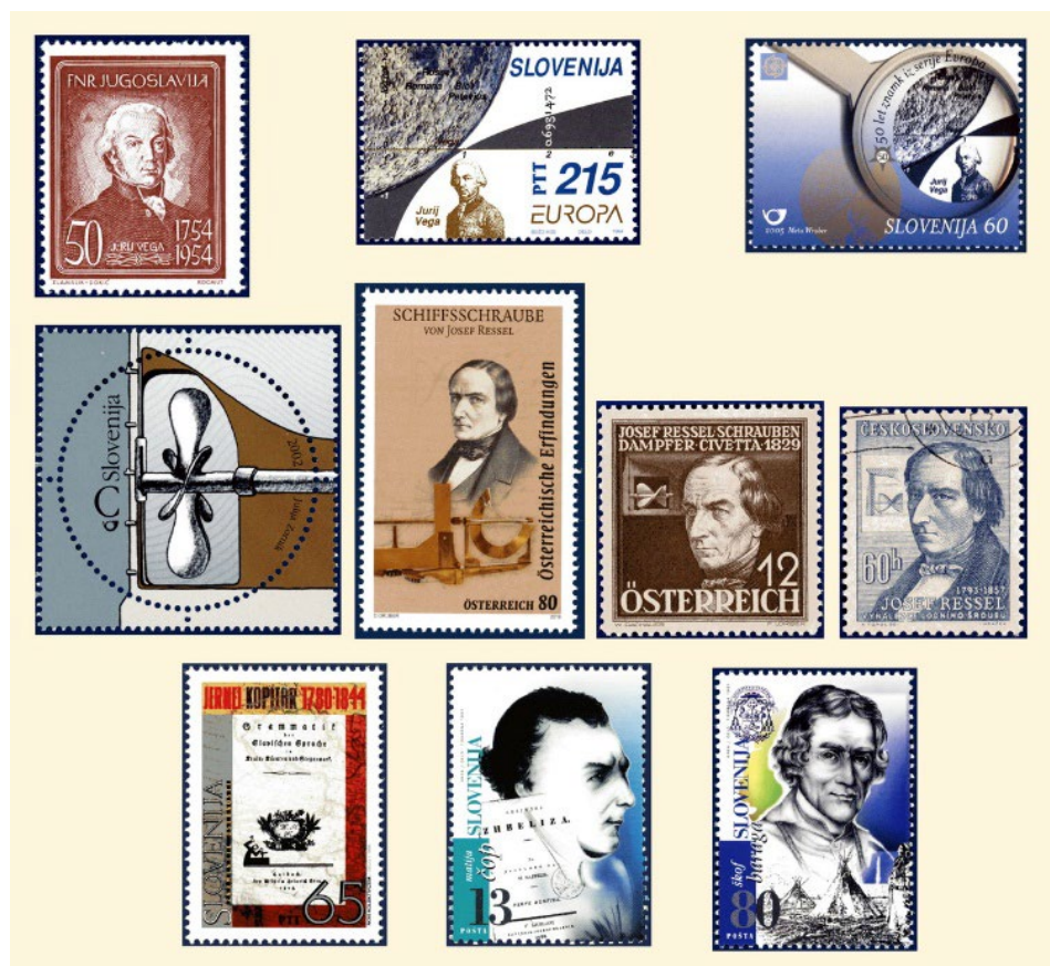
Slika 4: Znamke posvečene znanstvenikom, ki so bili rojeni v 2. polovici 18. stoletja. V zgornji vrsti so znamke z Jurijem Vegom, v srednji z Ludvikom Resselom in v spodnji pa so posvečene Jerneju Kopitarju, Čopu in Frideriku Baragi.

Gozdar in izumitelj ladijskega vijaka Josef Ludvík František Ressel (1793–1857) je prišel s Češke, deloval pa je na Krasu. Njemu sta posvečeni dve avstrijski ter po ena čehoslovaška in slovenska znamka. Njegovo podobo srečamo tudi na bankovcu za 500 avstrijskih šilingov. Misionar, slovníčar in popotnik Irenej Friderik Baraga (1797–1868) je bil utemeljitelj knjižnega jezika indijanskih plemen Očipve in Otava. Bil je ter prvi marquetteški škof ter avtor prve slovenske knjige z opisom življenja in značilnosti severnoameriških Indijancev. Barago najdemo na slovenski znamki in na ameriški dopisnici.