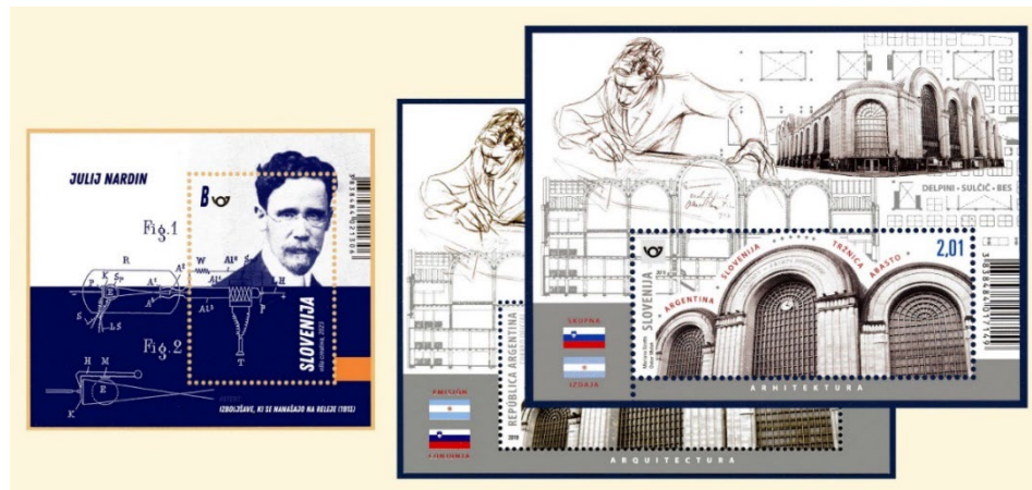
Slika 11: Na levi strani je blok posvečen Juliju Nardinu, na desni pa sta slovenski in v ozadju argentinski blok posvečena Viktorju Sulčiću