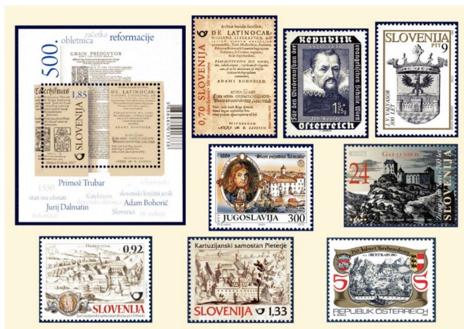
Slika 1: Znamke posvečene znanstvenikom, ki so bili rojeni do začetka 18.stoletja. V zgornji vrsti je blok in znamka z Bohoričevo slovnico, Joannes Kepler in Valvazorjev grb. V srednji vrsti je znamka posvečena Valvazorju, ostale znamke pa imajo za predlogo ilustracije iz Slave vojvodine kranjske.

Ob uvedbi poštnih znamk so te prikazovale predvsem vladarje in državne simbole. Kasneje so se na znamkah pojavile druge upodobitve. Znamke so postale medij, ki je predstavljal značilnosti in dosežke države izdajateljice. Zato so na znamkah pogosto tudi znane osebnosti. V jugoslovanskem obdobju so bili na znamkah prikazani predvsem revolucionarji in umetniki. Le redke znamke so bile posvečene znanstvenikom. Z osamosvojitvijo Slovenije se znamke z znanstveniki pojavljajo pogosteje. V tem prispevku bomo predstavili ob slovenskih znanstvenikih tudi tiste tuje znanstvenike, ki so delovali ali bivali na prostoru Slovenije in so bili predstavljeni na znamkah ali na denarju.