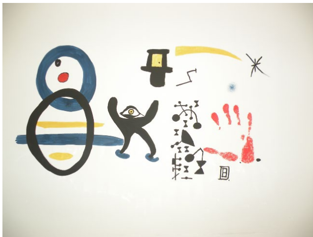
Slika 1: Organizirana kriminaliteta

razložiti, kaj je organizirana kriminaliteta? Najlaže s sliko. Za lažjo ponazoritev sem zato narisal sliko organizirane kriminalitete v Mirójevem abstraktnem slikovno-znakovnem stilu. Slika je bila tudi naslovnica knjige Preiskovanje kriminalitete v zvezi z umetninami (Dobovšek, 2010). 1