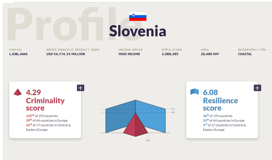
Slika 2: Indeks organizirane kriminalitete za Slovenijo v letu 2021

okrepijo nacionalno, regionalno in globalno sodelovanje v boju proti organizirani kriminaliteti.