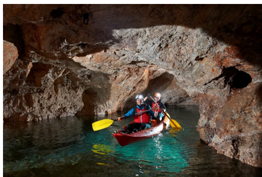
Sliki 5 in 6: Interpretacija Podzemlja Pece