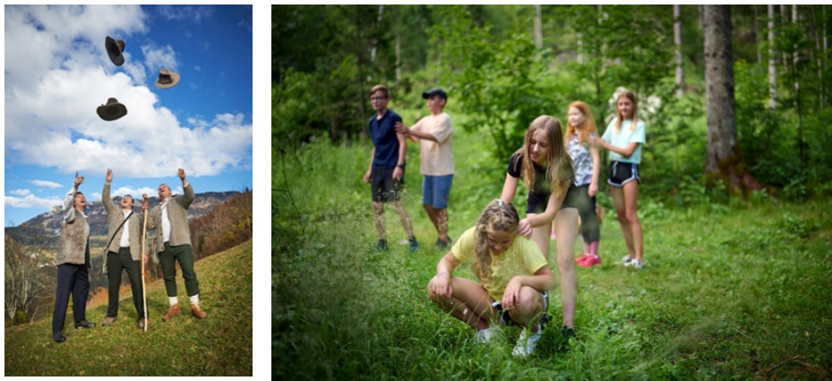
Sliki 1 in 2: Interpretacija na Solčavskem

V Zavodu za pristna doživetja, Poseben dan, se posvečajo predvsem osebni interpretaciji. Z njimi in pri njih se lahko doživi naravo in dediščino Solčavskega skozi interpretacijski nastop, interpretativno vodenje, gozdne igrarije, pripovedovanje zgodb, prikaz starih veščin, etnoanimacijo in uprizorjanje preteklosti (sliki 1 in 2).