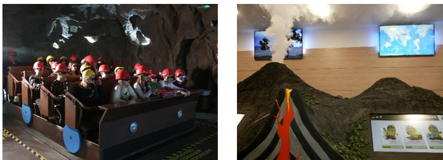
Sliki 3 in 4: Prikaz vulkanizma v Doživlajskem parku Vulkanija

V Doživlajskem parku Vulkanija s pomočjo sodobnih interaktivnih vsebin in 3D stereoskopske tehnike prikažejo gorički vulkan in vulkanizem (sliki 3 in 4). Tako obiskovalcem približajo naravo in procese, pri katerih neposreden stik in izkušnja nista ravno mogoča.