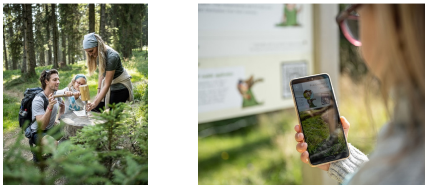
Sliki 9 in 10: Interpretacija na Škratovi poti na Rogli

Interpretacija za otroke ni le poenostavitev interpretacije za odrasle, ampak jo je treba skrbno načrtovati. Škratova pot na Rogli (sliki 9 in 10) z gibanjem v naravi združi potep po postajah, opremljenih s tablamami in štampiljkami, aplikacijo in slikanico o Pohorskem škratu.