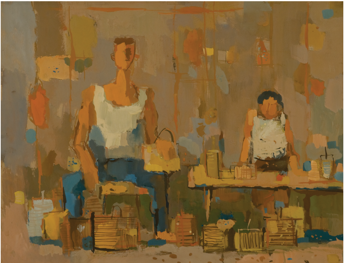
Prodajalci košar, 1969