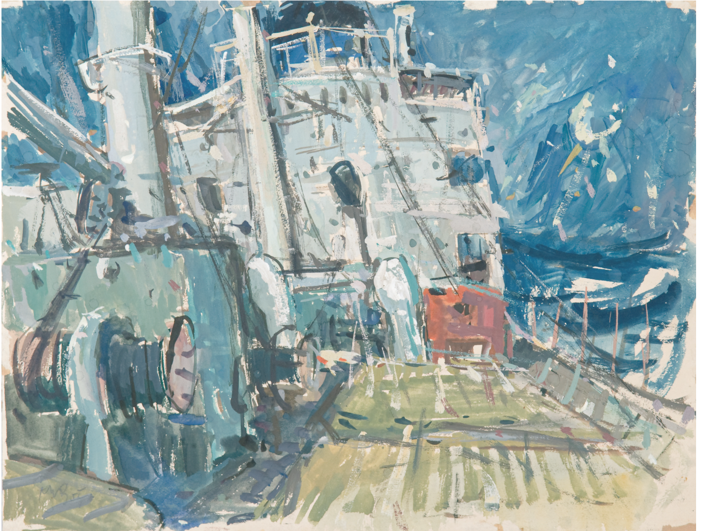
Na ladji Zagreb, 1954