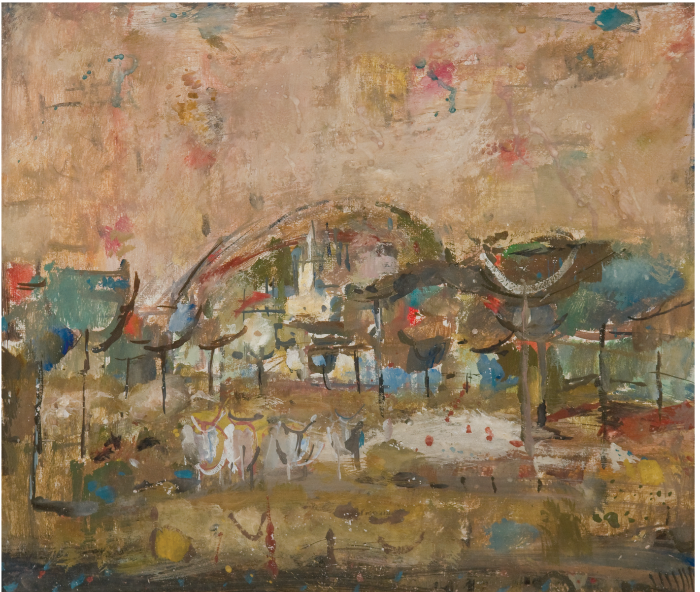
Krajina s cerkvijo, brez sign.