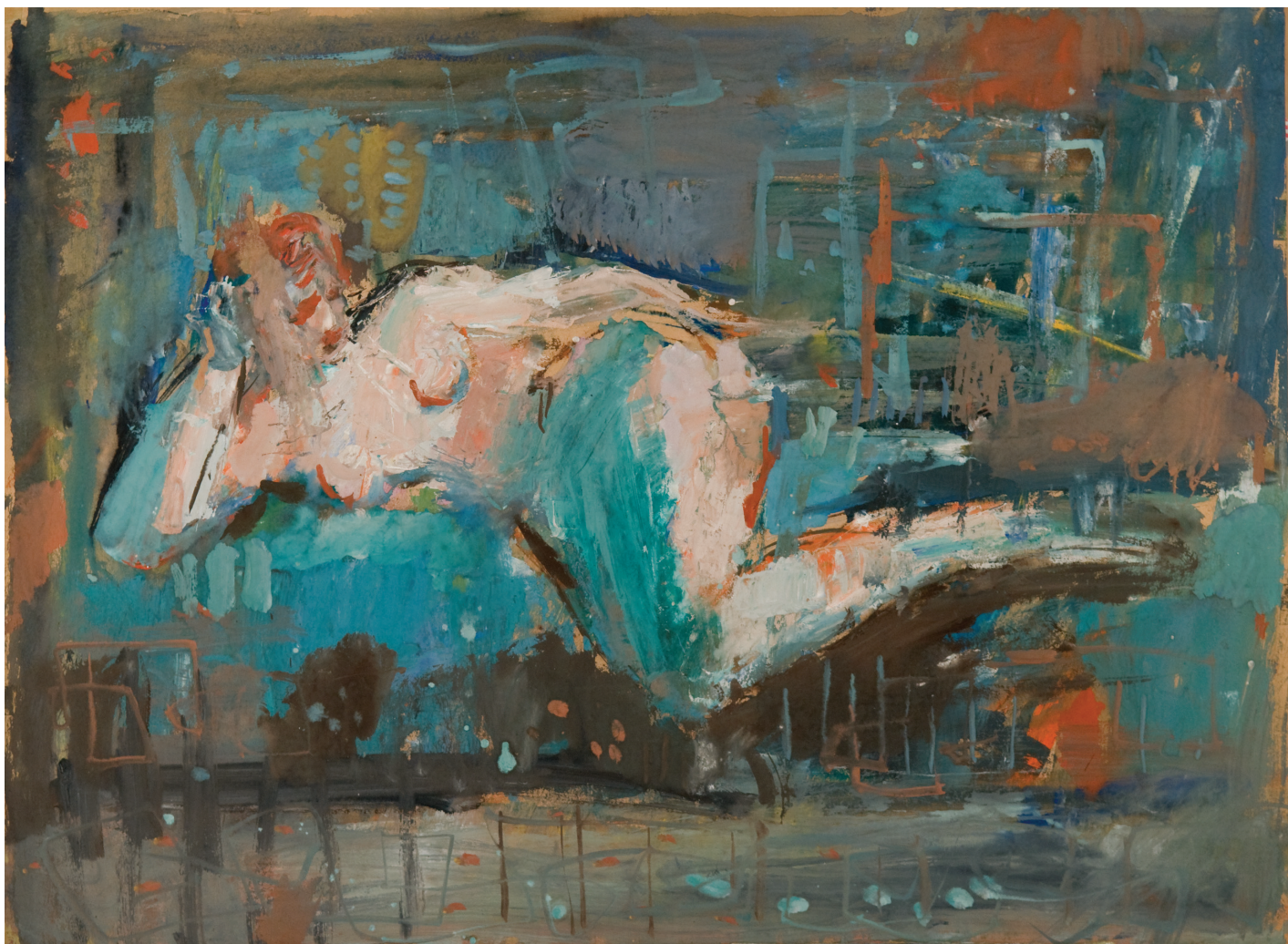
Ženski akt, 1970