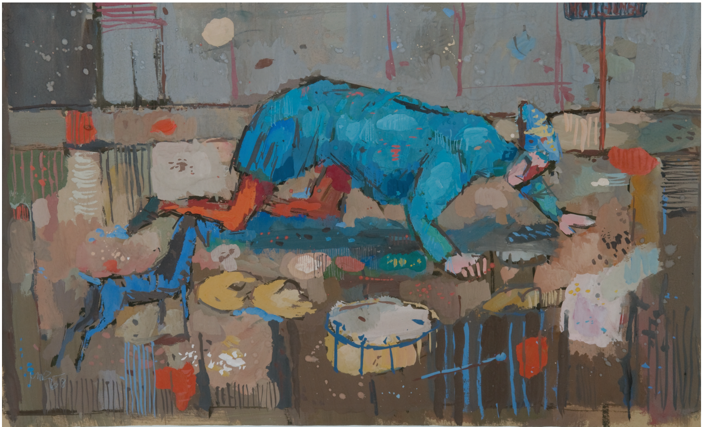
Pijani bobnar, 1968