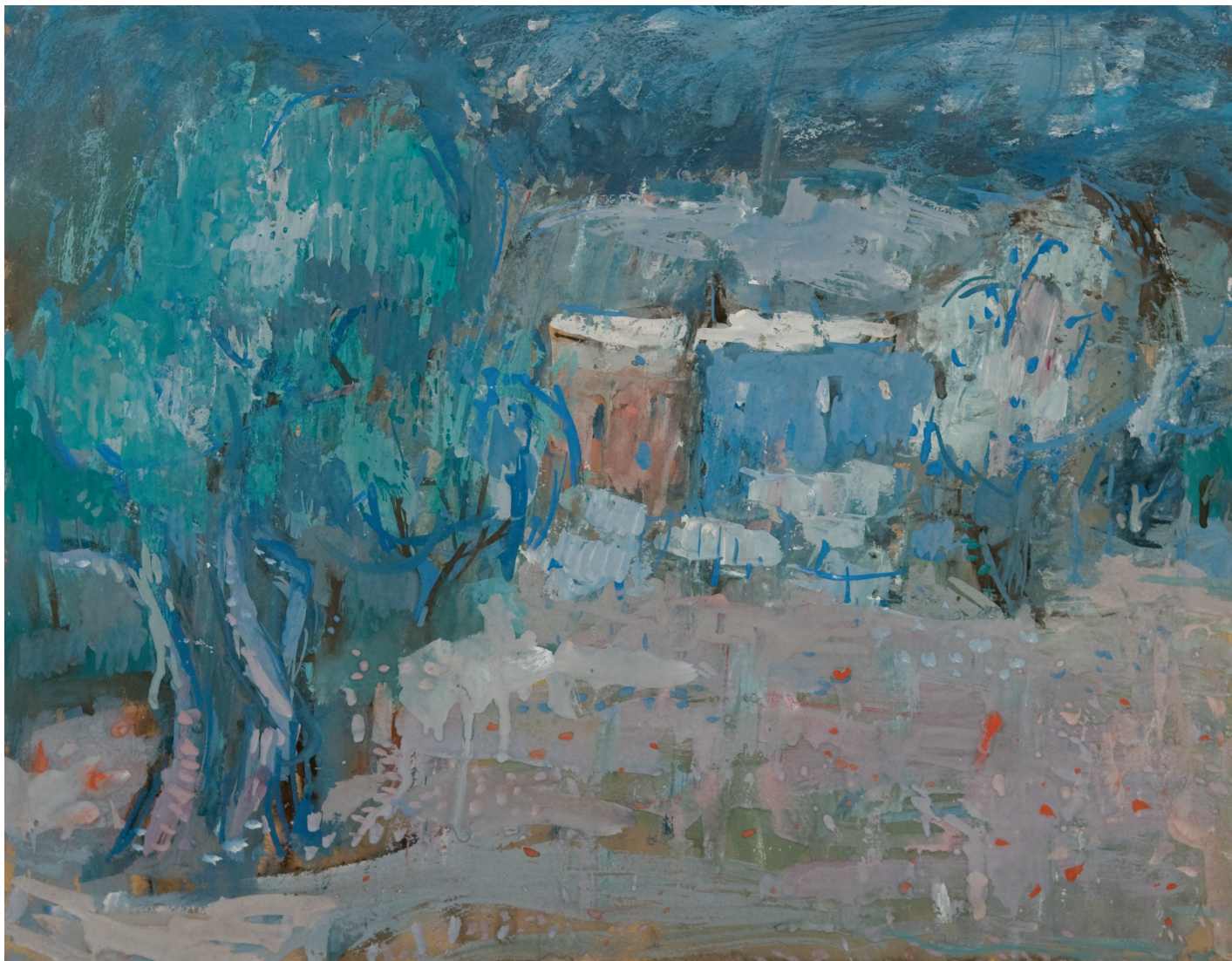
Hiše ob oljki, 1972