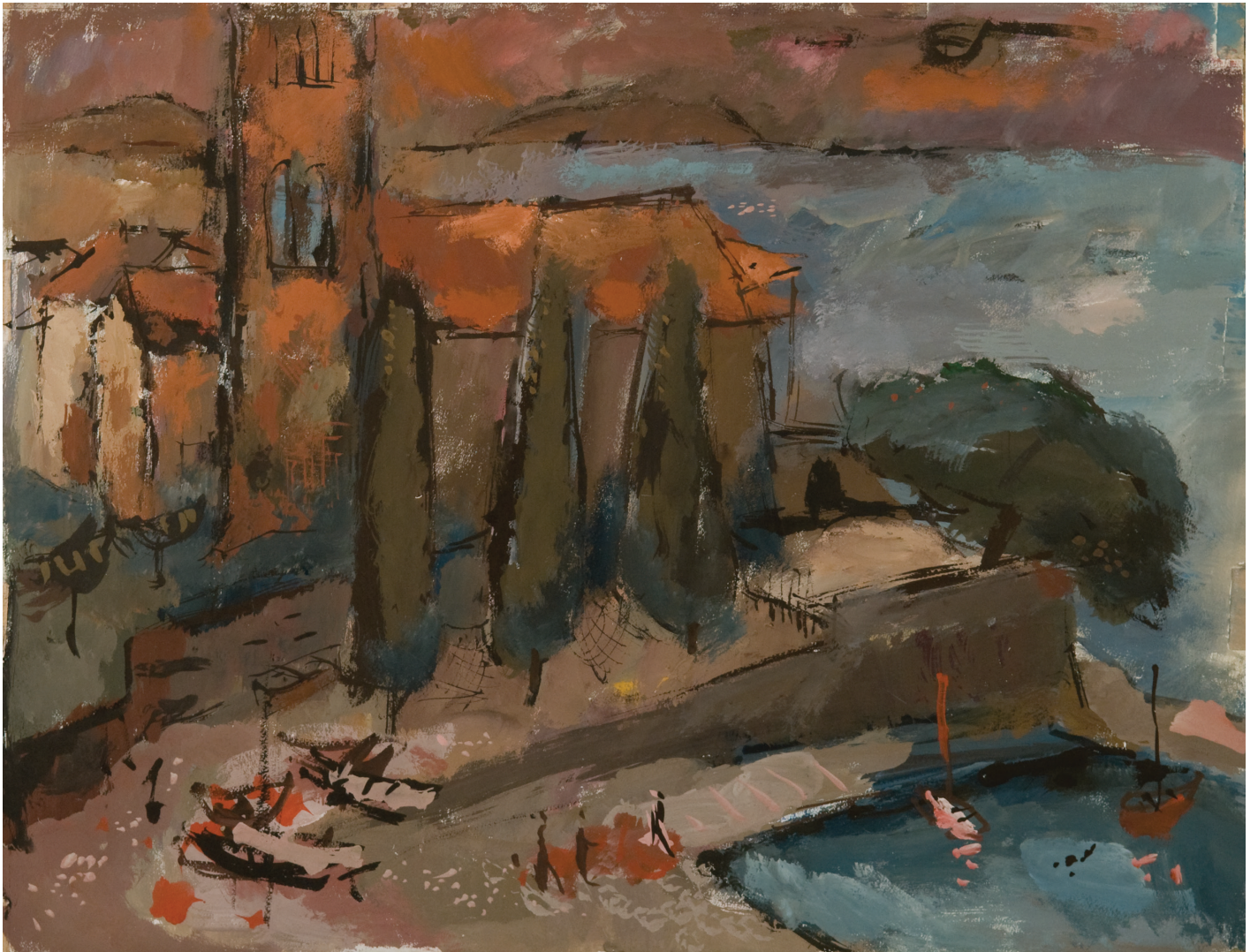
Samostan na Hvaru, brez sign.