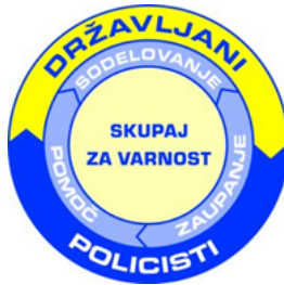
Slika 1: Shema delovanja policijskega dela v skupnosti

policije (Ministrstvo za notranje zadeve, Policija, n. d. b) je danes na območju Republike Slovenije ustanovljenih in delujočih 185 varnostnih sosvetov. Policija PDS jemlje resno, kar kaže tudi shema, ki je objavljena na uradni spletni strani Policije. Iz sheme na sliki 1 je razvidno, da si prizadevajo resno sodelovati z državljanji.