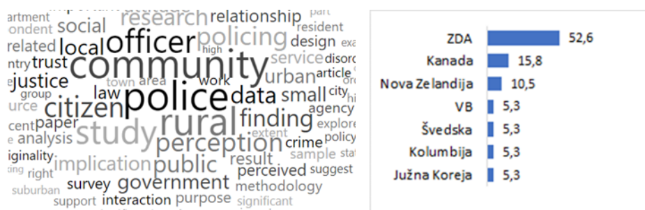
Slika 2: Izsek najpogostejših besed (levo) in članki po državah (desno)

Samodejno razvrščanje povzetkov člankov na temo policijskega dela v skupnosti v ruralnem okolju pokaže štiri vsebinsko sorodne skupine člankov. Prva skupina vključuje mnenje prebivalcev o policiji in vključuje 19 (28 %) prispevkov. Izsek najpogostejših besed in porazdelitev prispevkov, glede na državo, kjer je bila raziskava izvedena, sta prikazana na sliki 2. V to skupino je vključenih 18 raziskovalnih in en teoretični prispevek. Polovica raziskav je bilo kvalitativnih in polovica kvantitativnih. Raziskave so bile pretežno narejene s policisti ali prebivalci, ena pa je vključevala analizo zapisov na družbenem omrežju Facebook.