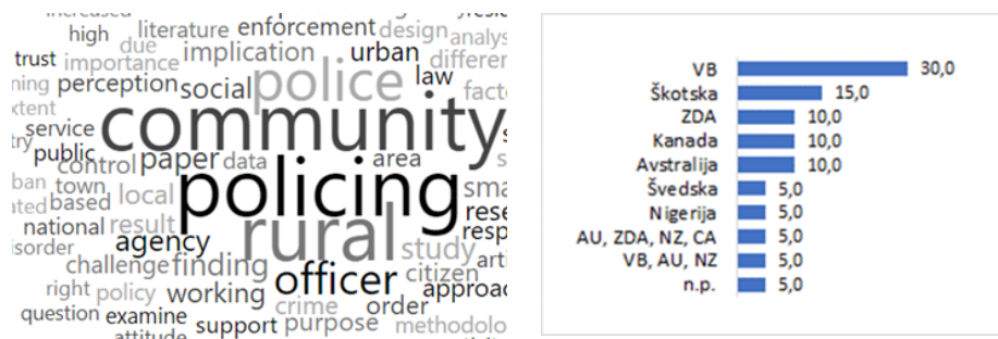
Slika 5: Izsek najpogostejših besed (levo) in članki po državah (desno; NZ = Nova Zelandija; VB = Velika Britanija, CA = Kanada)