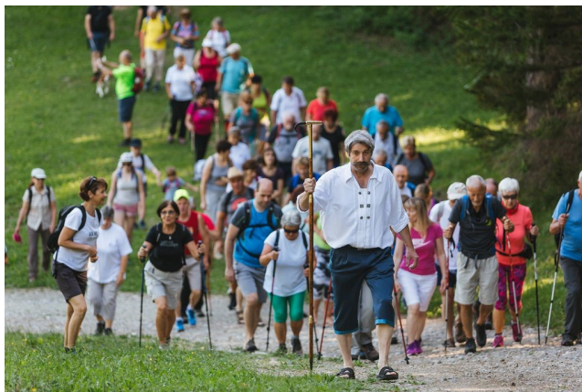
Slika 2: Riklijev pohod na Stražo

Vsako prvo nedeljo v juliju Turistično društvo Bled organizira Riklijev pohod po Riklijevi trim stezi na Stražo, kamor je tudi Rikli vodil svoje paciente. V program je vključen zajtrk na vzpetini Straže, nato zračne, sončne in vodne kopeli in kosilo na travniku ob jezeru. Po Riklijevem nasvetu priporočajo za pohod lahkotna oblačila svetlih barv, slamnike in bose noge. Turistično društvo Bled vsak torek v juliju in avgustu organizira tudi jutranji pohod na Stražo, imenovan Bosi po rosi (Riklijev pohod 2019).