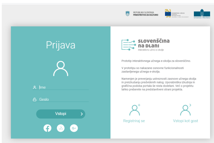
Slika 2: Vstop v učno e-okolje Slovenščina na dlani (beta verzija)