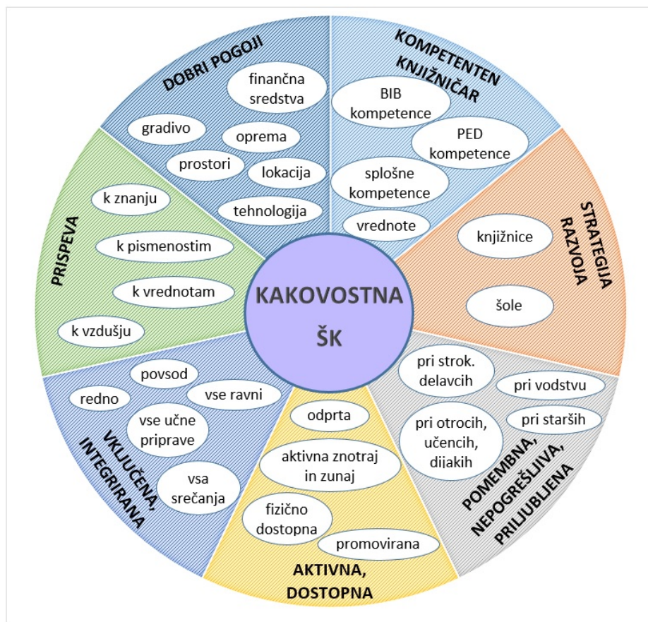
Slika 3: Model kakovostne šolske knjižnice v slovenskem okolju

knjižničarske in izobraževalne stroke ter splošne javnosti in podobno. Seveda je za to potrebno razviti mnogo orodij in pristopov, bi se pa s tem pričele zmanjševati velike razlike med šolskimi knjižnicami, ki jih ugotavljajo zadnje raziskave (Škufca 2019). Kakovostna šolska knjižnica v slovenskem okolju ima torej naslednje povezane in soodvisne elemente.