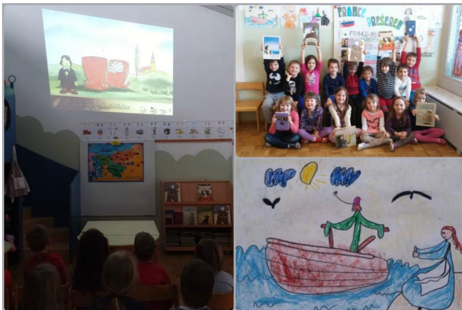
Slika 5: Projekt o slovenskem kulturnem prazniku