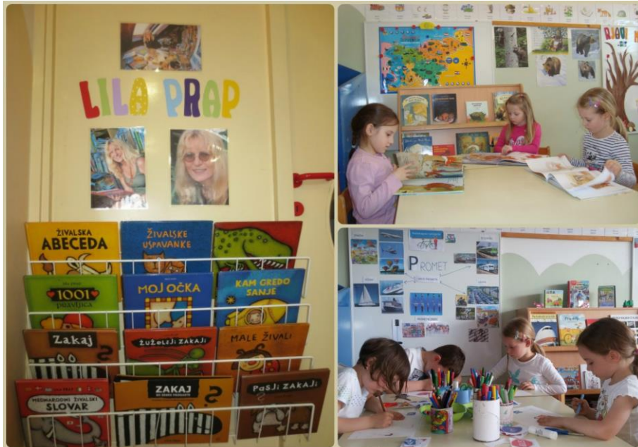
Slika 3: Avtorski in tematski knjižni kotički

V oddelku skrbim, da imajo otroci poleg vsakodnevnega branja/poslušanja pravljič in drugih literarnih del možnost dostopa do kakovostnih slikanic, ilustriranih knjig in revij v knjižnem kotičku, ki ga skupaj urejamo tematsko, ko raziskujemo izbrano temo (Bednjički Rošer 2016; 2015b) ali avtorsko z namenom ozaveščanja, da so zgodbe (pripovedovane, brane) ustvarili drugi, saj je ločevanje avtorja in pripovedovalca/bralca predšolskemu otroku v slušni recepcijski situaciji težavnejše kot kasneje v bralni situaciji (Bednjički Rošer 2014).