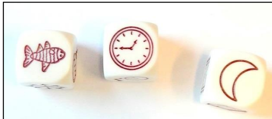
Slika 1: Prikaz kombinacije kock

Kdo je na sliki? Kako je ribi ime? Kaj se zgodi? Otrok naj smiselno pojasni simbol ure (na primer: riba se odpravlja spat). Riba mora spati, ker je na zadnjem simbolu Luna (otrok Luno večinoma povezuje z nočjo).