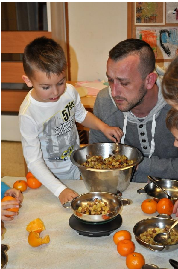
Slika 1: Tehtamo sestavine

V predopismenjevalnem kotičku so kozarčke opremili z napisom – nalepko in jih okrasili še s platneno krpico ter vrvjo. Nato so si »prepisali« ali prerisali še recept ter dobili navodilo, da ponudijo čarmelado vsakomur, za katerega želijo, da za vedno ostane njihov prijatelj. Otroci so ob zaključku delavnice prejeli slikanico Čarmelada in odnesli domov v vrtcu pripravljeno čarmelado. Iz številnih odzivov po delavnici lahko sklepamo, da so nalogo vzeli resno in so poustvarjali tudi doma.