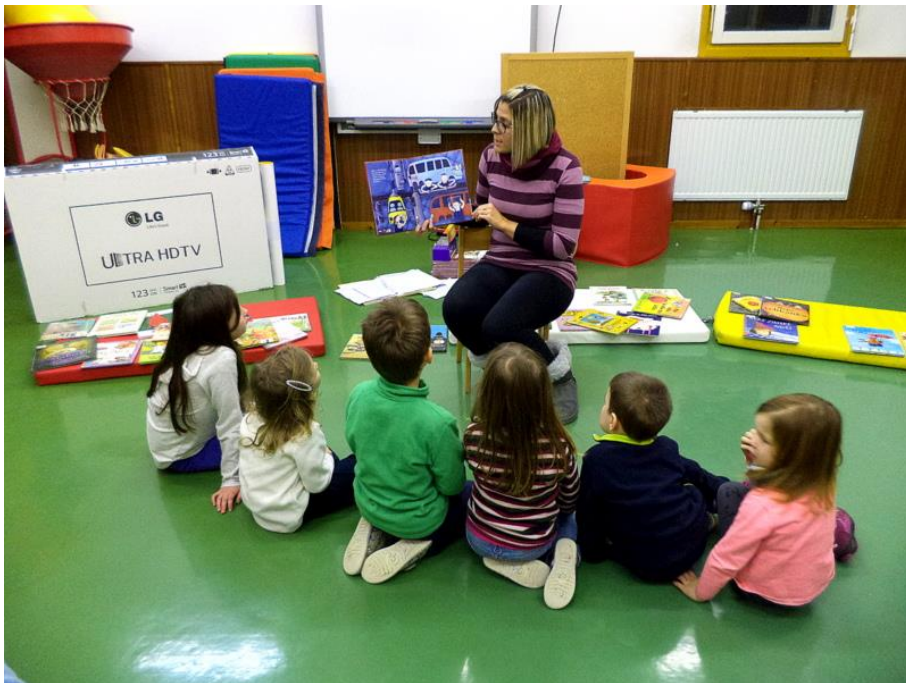
Slika 2: Otroci poslušajo zgodbo o rožnatem avtobusu

V nadaljevanju sem jim predstavila slikanico Rožnati avtobus pisateljice Vesne Radovanovič. Otroci in starši so pozorno prisluhnili brani zgodbi. Po končanem branju smo slikanico ob ilustracijah skupaj obnovili. S pomočjo vprašanj, ki sem jim jih v nadaljevanju zastavila, so otroci iskali in spoznavali matematične vsebine v slikanici. Vprašanja so bila: Katerih barv in oblike so avtobusi? , Kakšne razlike opazimo med njimi? , Katera števila najdemo v ilustracijah, kaj nam ta števila sporočajo? , Kje vozijo avtobusi? , Kakšne so ceste, po katerih vozijo? Ob koncu sem otroke spodbudila k iskanju rešitve zastavljenih problemov: Kaj lahko storimo, če se avtobus pokvari? , Kaj bi naredil, če bi kje našli zapuščen avtobus?