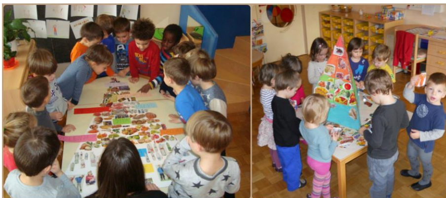
Slika 4: Projekt o zdravem življenjskem slogu