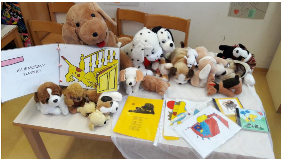
Slika 2: Škatla za opismenjevanje (Piki)

Slika 1 prikazuje vsebino škatle za opismenjevanje z naslovom Muca Copatarica, ki otrokom ponuja raznolike dejavnosti za razvoj različnih spretnosti. Prvotno je narejena za otroke drugega starostnega obdobja, vendar se vsebino vseh škatel lahko prilagodi za vse starosti.