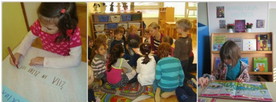
Slika 1: Porajajoča se pismenost