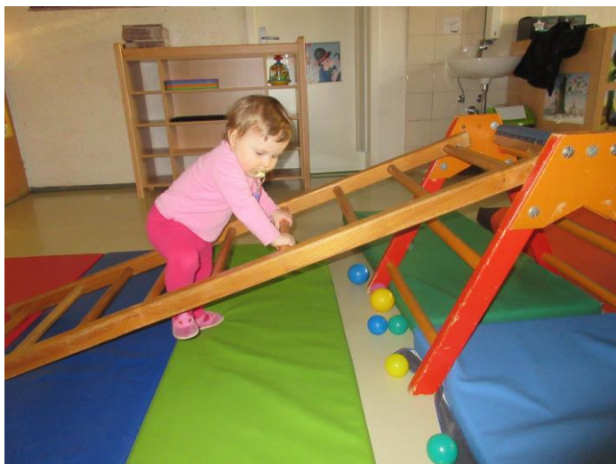
Slika 4: Plezanje po lestvi ob poslušanju ritmične izjave: »Metoda neroda, po lojtri je šla...«

izgovarjali ob raziskovalnih in motoričnih dejavnostih. Želeli smo, da imajo otroci priložnost slišati pesmi in rime ob vsakodnevnih, njim prijetnih dogodkih. Poslušanje pesmi je namreč tudi ena izmed številnih dejavnosti, ki spodbujajo razvoj zgodnje pismenosti. V gibalnem kotičku, kjer so otroci plezali po lestvi in se nato spuščali po toboganu, je bilo gibanje pospremljeno z izjavo: »Metoda neroda po lojtri je šla, se lojtra zlomila, je padla na tla.« V kotičku z različno velikimi škatlami so slišali: »Mi se z vlakom peljemo, dobro voljo meljemo ...«, ob tem so otroci sedali v škatle, starši so jih lahko potiskali ali vlekli. Dajanje žogic v pokončno obrnjene stožce je bilo ubesedeno z izštevanko: »Sladoled, turški med ...«. Otroci so sledili navodilu in prinašali barvne žogice v tulce, veselje ob njihovem stresanju iz tulcev pa je bilo še večje. Pri izdelovanju bib (gosenic) iz odpadnih materialov so otroci imeli priložnost rokovati se z različnimi polnili (gumbi, stiropor, vata, časopisni papir), jih presipati, pobirati ter sodelovati pri polnjenju nogavic, iz katerih so nato nastale bibe.