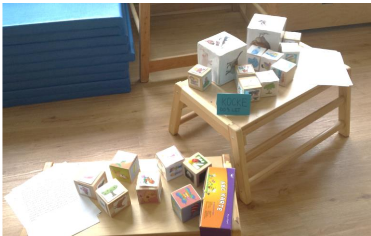
Slika 2: Pripovedovalne kocke, ki smo jih izdelali v vrtcu za otroke, stare do 3 let

nalepili na večje kocke. Kocke so bile velikosti 7,5 cm, kot je prikazano na sliki 2. Izbrali smo simbole, ki so otrokom znani in za katere smo predvidevali, da jih bodo znali poimenovati.