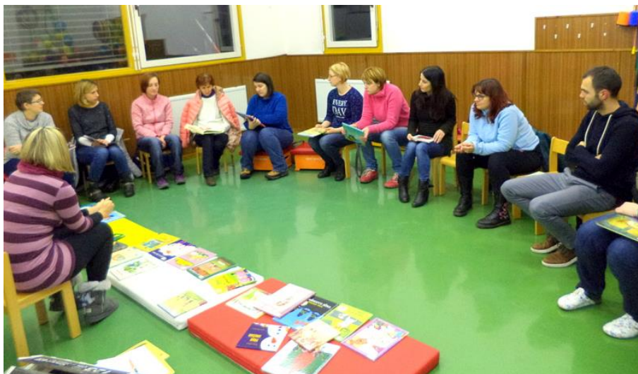
Slika 1: Pogovor s starši o matematiki v slikanicah

Prvih nekaj minut srečanja sem namenila samo staršem s ciljem, da jim predstavim nekaj informativnih in leposlovnih slikanic, prek katerih lahko otroku na zabaven in prijeten način predstavijo svet matematike. Starši so prek igre »vihar možganov« obudili znanje, kaj vse matematika je, nato pa med različnimi pripravljenimi slikanicami izbrali eno ter v njej iskali matematične vsebine. Pri tem seveda ni šlo brez ustvarjalnih izzivov in občasnih težav. Starši so precej hitro v slikanicah prepoznali števila, geometrijska telesa, like. Izziv pa jim je bil prepoznati, poiskati razvrščene predmete, položaje predmetov v določenem prostoru, količine in merske enote. Ob predstavitvi matematičnih vsebin, ki so jih starši našli, sem za spodbudo dodala še tiste matematične vsebine, ki jih niso prepoznali, četudi so v vsebini slikanice prisotne. Starši so bili presenečeni nad spoznanjem, da lahko sama slikanica vsebuje toliko elementov matematike.