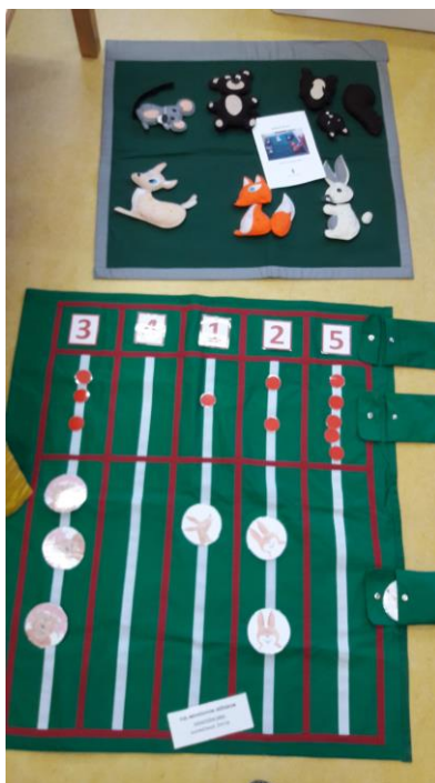
Slika 4: Didaktična igra Gozdne živali

Kostume je sešila šivilja Melita, ki je sodelovala pri ustvarjanju vseh škatel za opismenjevanje. Kostumi na sliki 3 so izdelani za škatlo za opismenjevanje z naslovom Zrcalce.