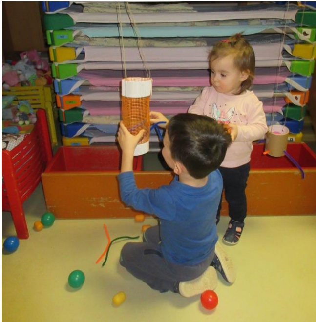
Slika 2: Odstranjevanje kosmatih žic in opazovanje žogic