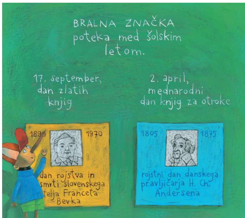
Slika 2: Tilka Jamnik in Peter Škerl: Ostržek bere za bralno značko, 2015: 8.

Temeljni vprašanja bralne značke pri vseh starostnih stopnjah in v vseh bralnih skupinah sta: izbor del za branje (priporočilni sezname) in oblike, metode in načini dela, primerni za različne starostne skupine bralcev.