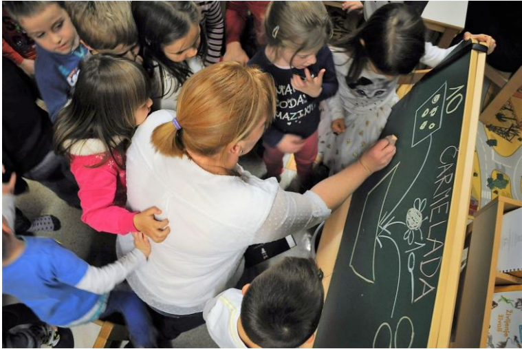
Slika 2: Rišemo slikopis recepta za pripravo čarmelade