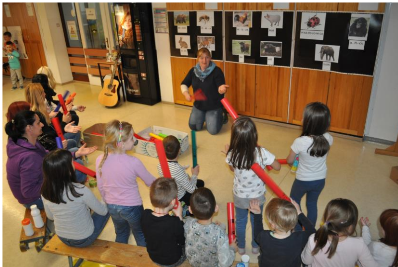
Slika 3: Ritmično izgovarjamo in izgovarjavo spremljamo z boomwhackersi