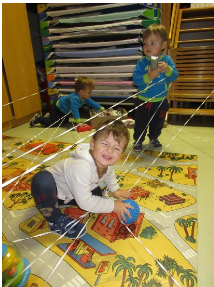
Slika 1: Gibanje v pajkovi mreži in rokovanje z ovitimi predmeti