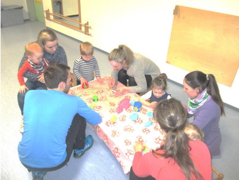
Slika 2: Otroci in starši pri skupni dejavnosti

izdelkov: okrogel, kvadraten, pravokoten, ter velikosti označevali kot majhen ali velik. Po barvah so jih razvrščali, klasificirali, preštevali in se z njimi igrali. Tako smo skupaj odkrivali področje likovne umetnosti in matematike.