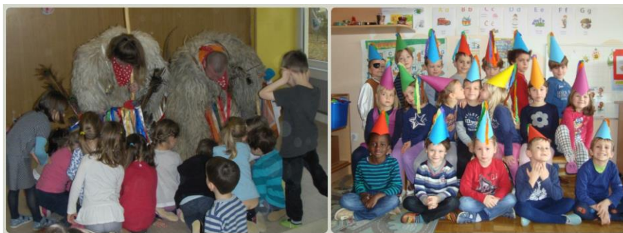
Slika 6: Projekt o slovenski kulturni dediščini

V vrtcu je prav vsak dan odlična priložnost, da pedagoški delavci kot profesionalni posredniki književnosti otrokom približamo odraščanje s slikanico in jih skozi književno in knjižno vzgojo popeljemo v svet bralcev za vse življenje (Bednjički Rošer 2013b).