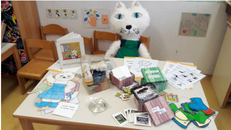
Slika 1: Škatla za opismenjevanje (Muca Copatarica)

Slika 1 prikazuje vsebino škatle za opismenjevanje z naslovom Muca Copatarica, ki otrokom ponuja raznolike dejavnosti za razvoj različnih spretnosti. Prvotno je narejena za otroke drugega starostnega obdobja, vendar se vsebino vseh škatel lahko prilagodi za vse starosti.