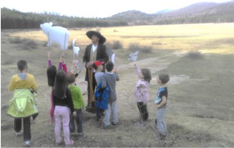
Slika 1: Martin Krpan in otroci

Pri izvedbi delavnic smo uporabljale uganke o živalih, o Martinu Krpanu in njegovemu življenju. Služile so kot motivacija pohodnikom na poti proti Petelinjskemu jezeru. Napisane so bile na »gozdnih živalih«, izdelanih iz lepenke. Zastavljene so bile tako, da so napovedale žival, ki smo jo moramo poiskati na poti.