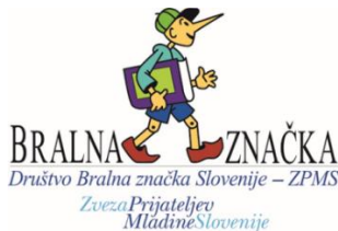
Slika 1: Znak Društva Bralna značka Slovenije – ZPMS