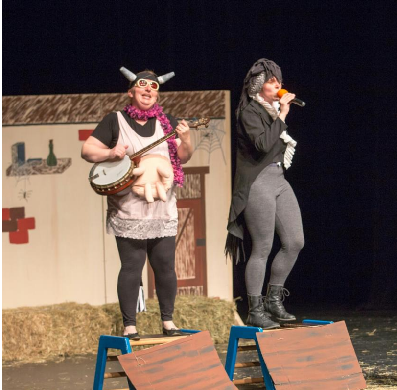
Slika 4: Scena iz dramske igre O kravi, ki je lajala v luno