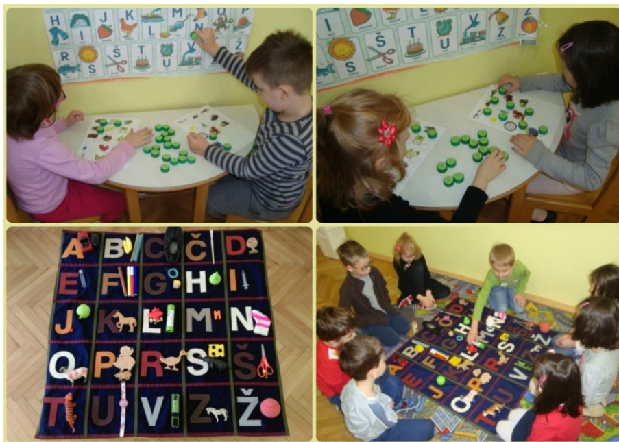
Slika 2: Didaktična igra Abeceda