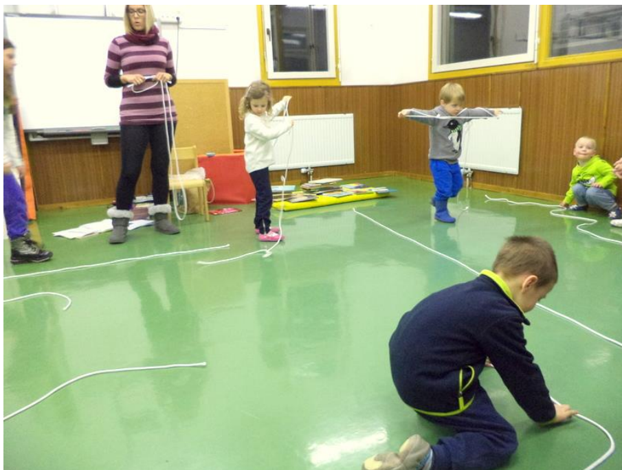
Slika 3: Otroci oblikujejo vrvice v ravne in vijugaste ceste

ugotovite, zakaj so vse ceste vendarle enako dolge. V nadaljevanju igre sem jih spodbudila k oblikovanju čim krajše ceste s pomočjo daljše vrvice. Nekaterim otrokom so priskočili na pomoč starši, večina pa je precej hitro in samostojno rešila nalogo. Otroci so oblikovali različne kratke ceste. Množico kratkih cest smo skupaj razvrstili po velikosti, od najkrajše do najdaljše.