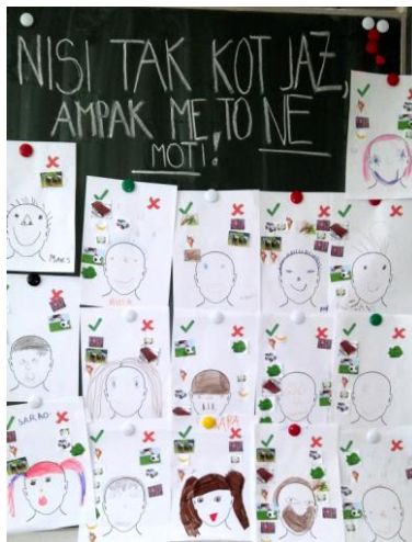
Slika 1: Nisi tak kot jaz, ampak me to ne moti!

Slika 1 prikazuje izdelke otrok. Prek slikanice so otroci na njim razumljiv način spoznali, kako smo različni. Vzgojiteljica je povedala, da tablo uporabi, kadar pride do nemira ali do žaljenja v skupini. Tako skupaj z otroki pogledajo na tablo in ugotovijo, da smo vsi med seboj različni in da je lepo, če so prijatelji in si med seboj pomagajo.