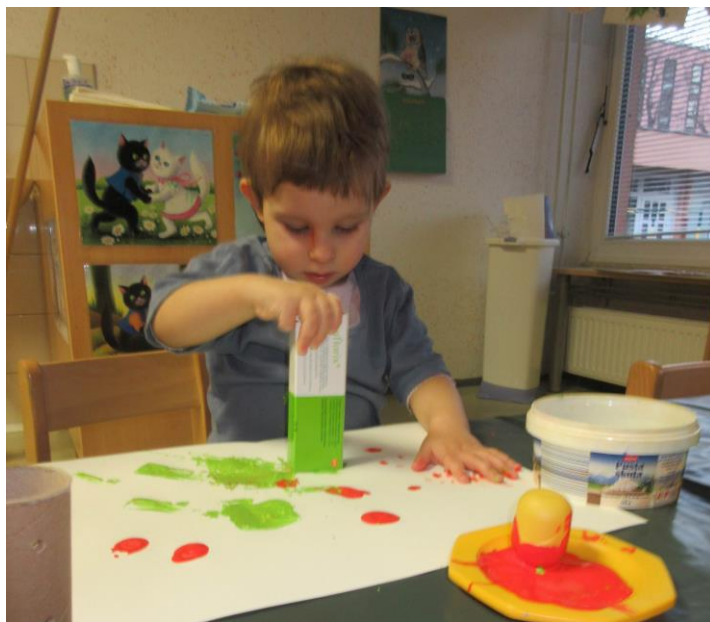
Slika 3: Tiskanje z odpadnimi materiali