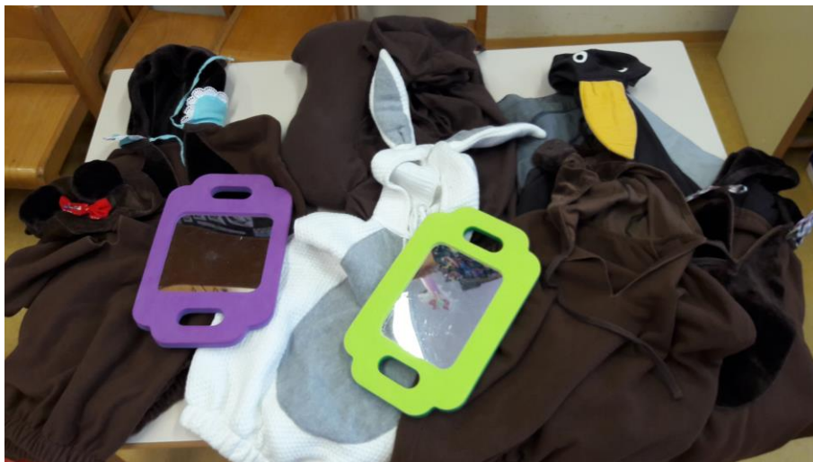
Slika 3: Kostumi za igro

Kostume je sešila šivilja Melita, ki je sodelovala pri ustvarjanju vseh škatel za opismenjevanje. Kostumi na sliki 3 so izdelani za škatlo za opismenjevanje z naslovom Zrcalce.